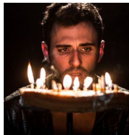
VUCCIRIA teatro: interessante promessa teatrale!