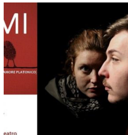
"Semi" al Sancarluccio: le parole e l'incomunicabilità